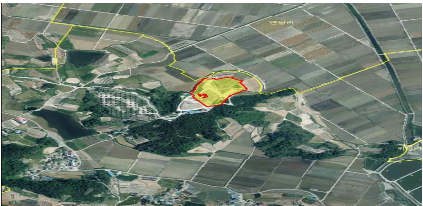
전남 해남군 황산면 외입리 산15-2