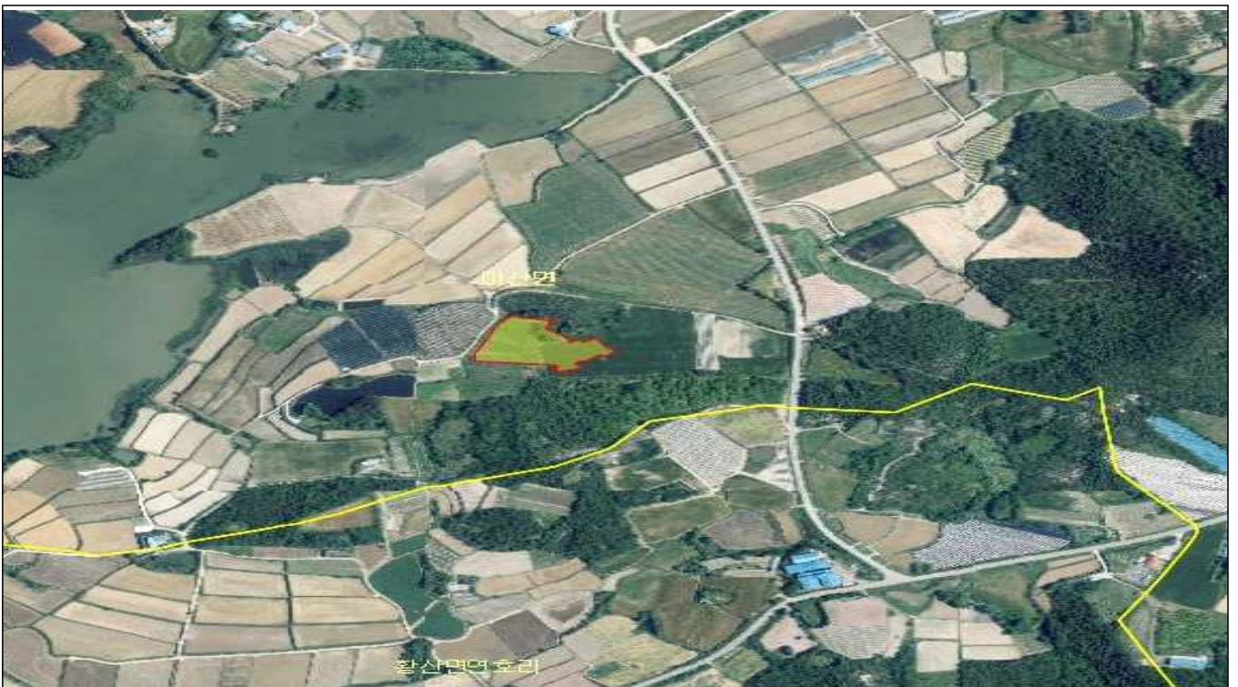
전남 해남군 마산면 학의리 산144-3 외 4필지