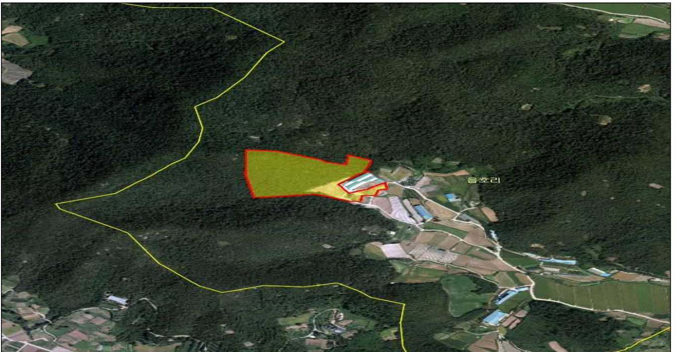
전남 해남군 현산면 읍호리 산144-2 외 1필지