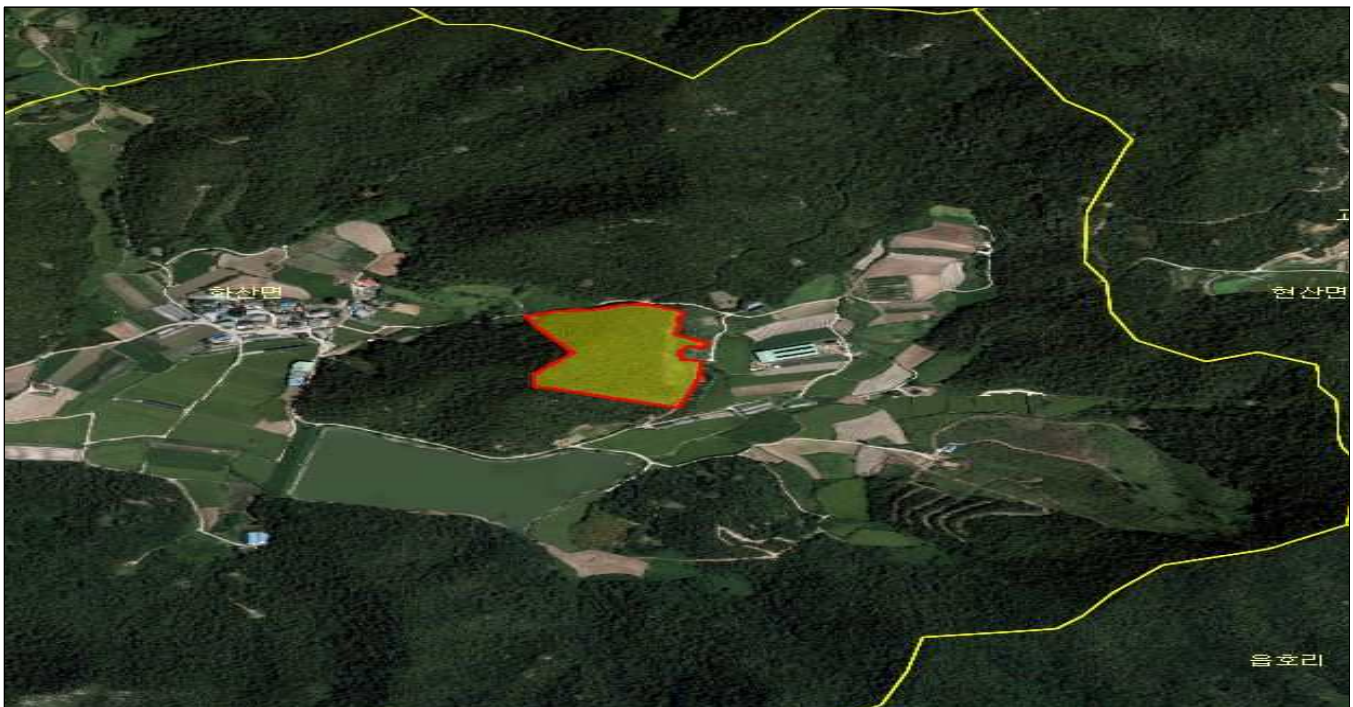
전남 해남군 화산면 송산리 산28