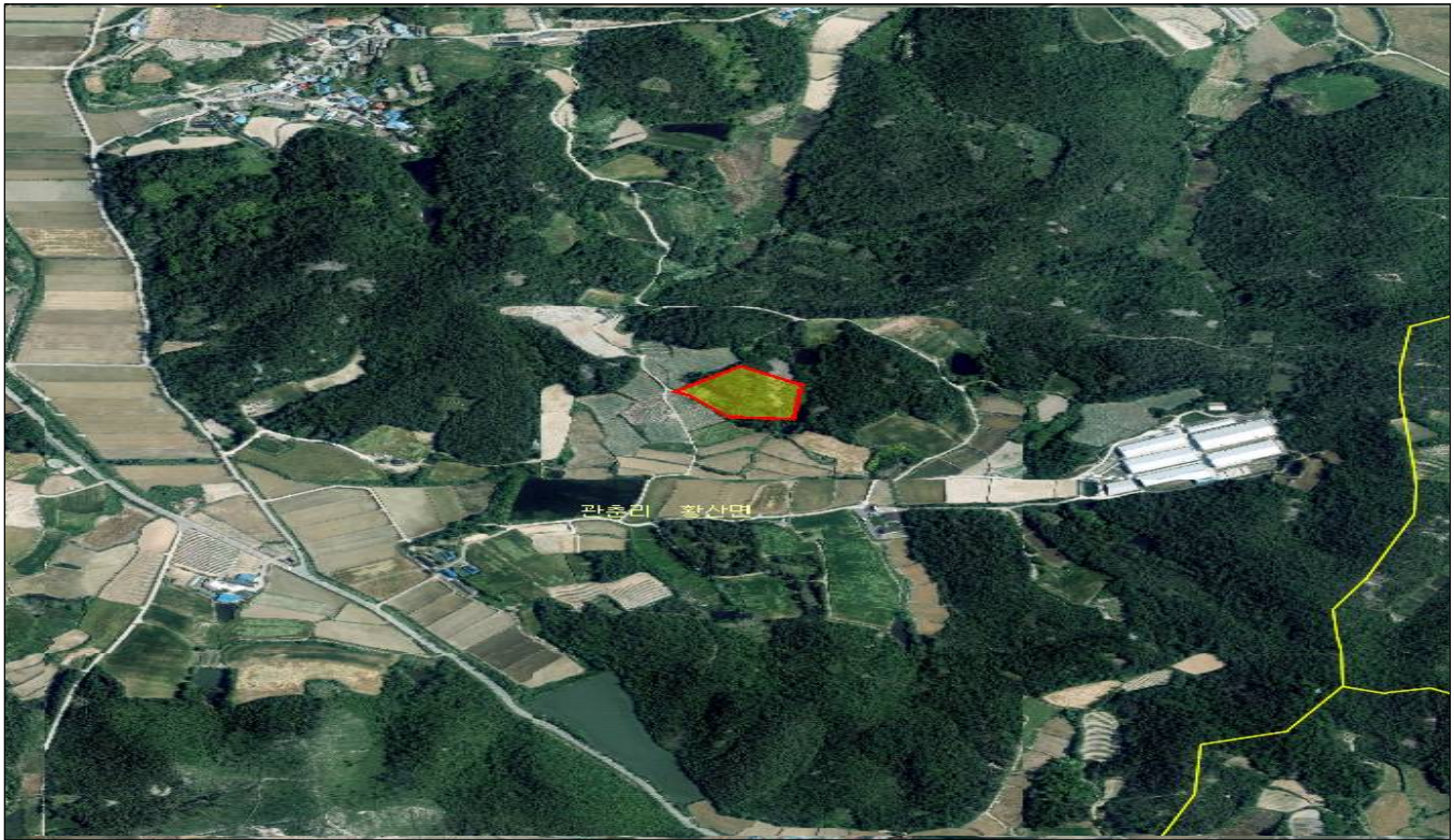
전남 해남군 황산면 관촌리 산224