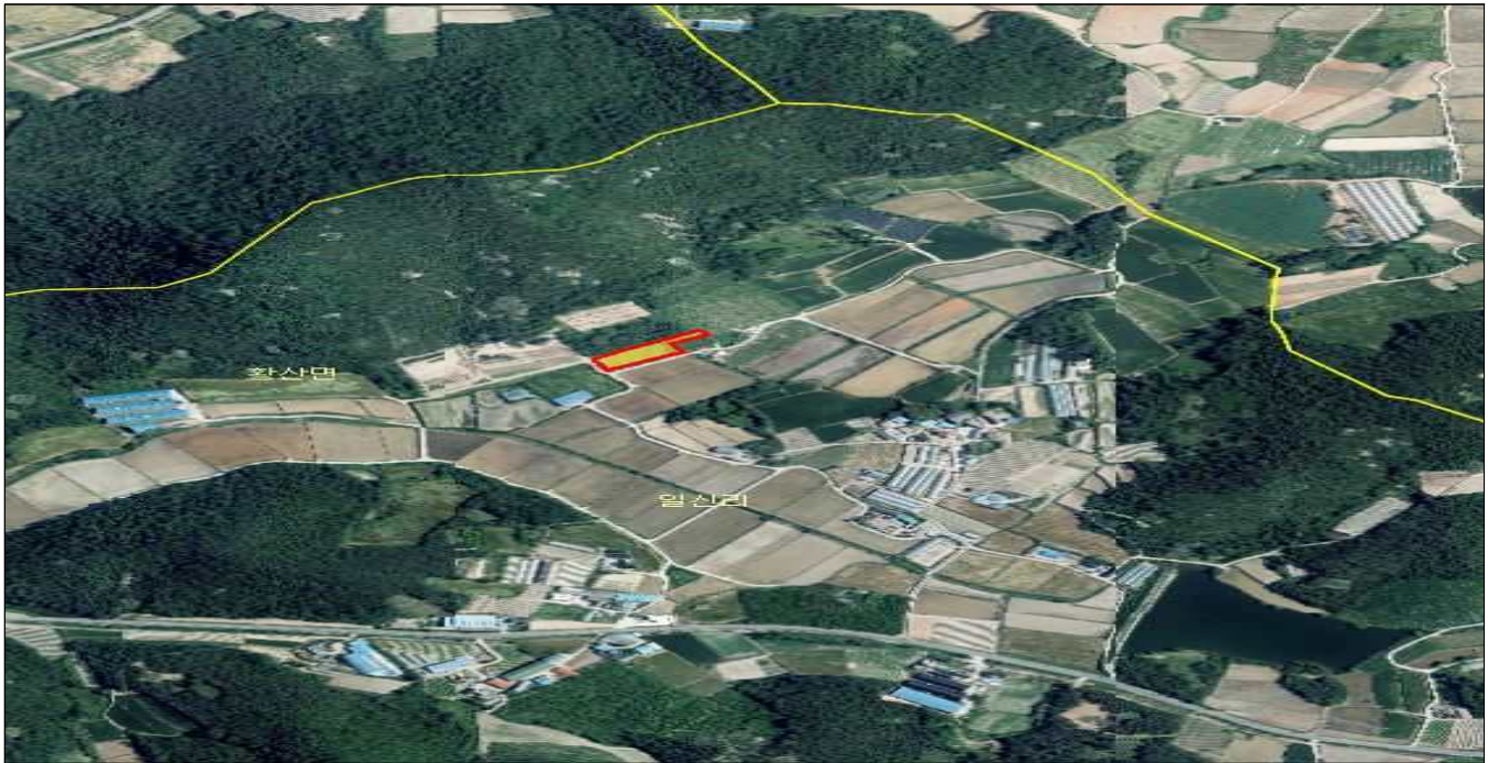
전남 해남군 황산면 일신리 산44-24