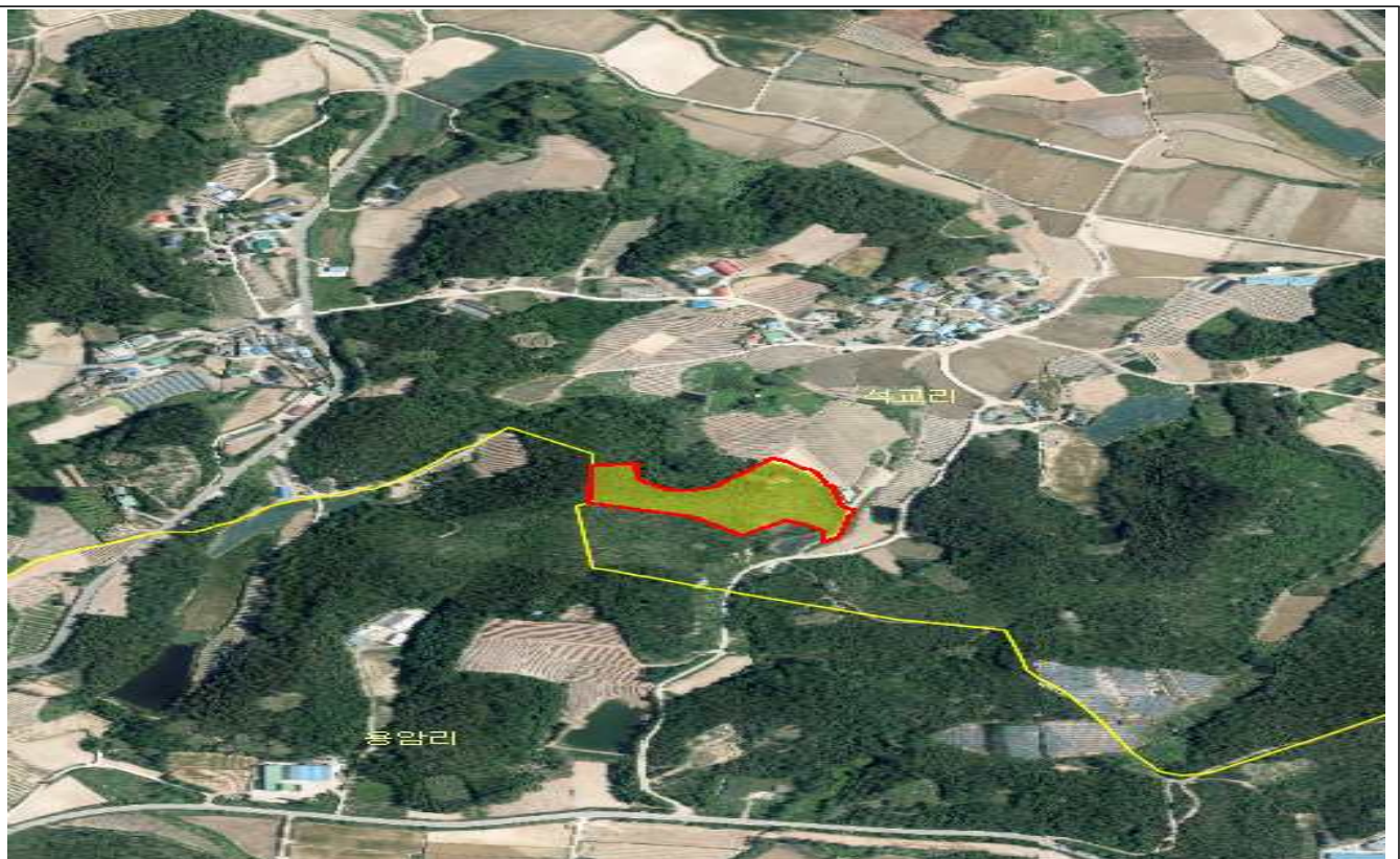
전남 해남군 문내면 석교리 산447