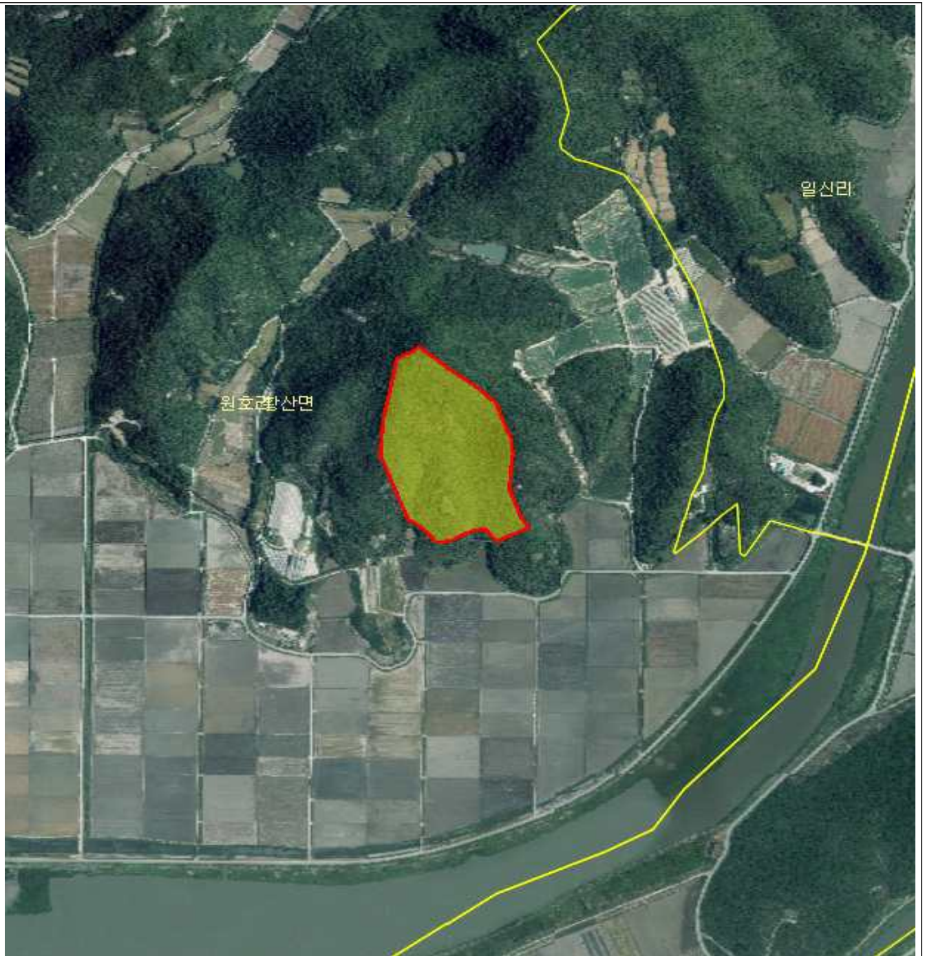
전남 해남군 황산면 원호리 산165