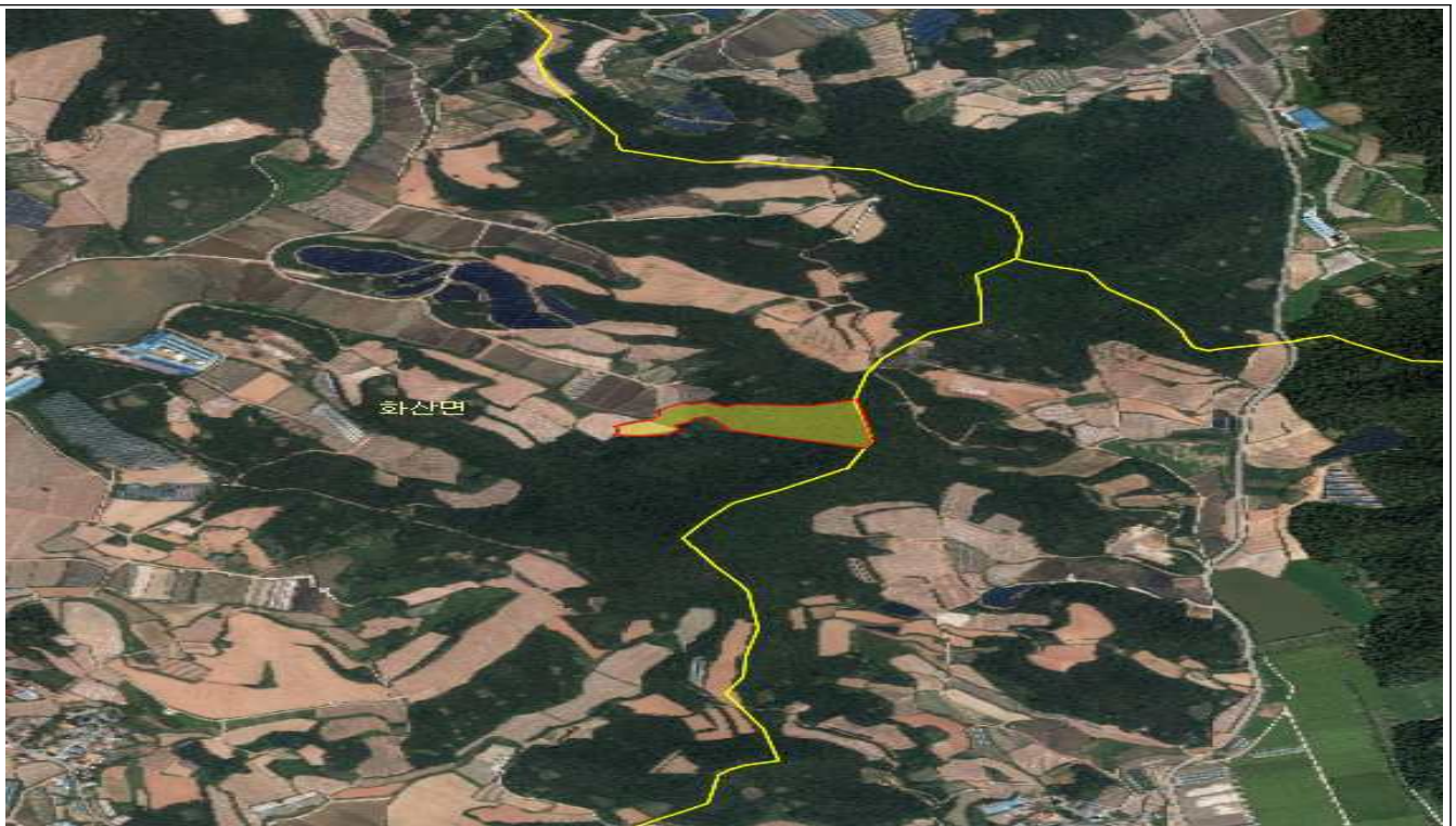
전남 해남군 화산면 석호리 산87, 산86-1, 68전, 70전