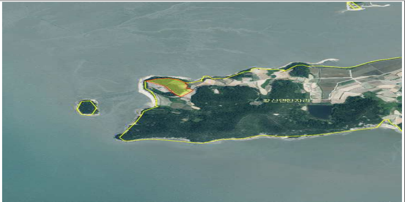
전남 해남군 황산면 한자리 산108-1, 1380전, 1388전, 1387대