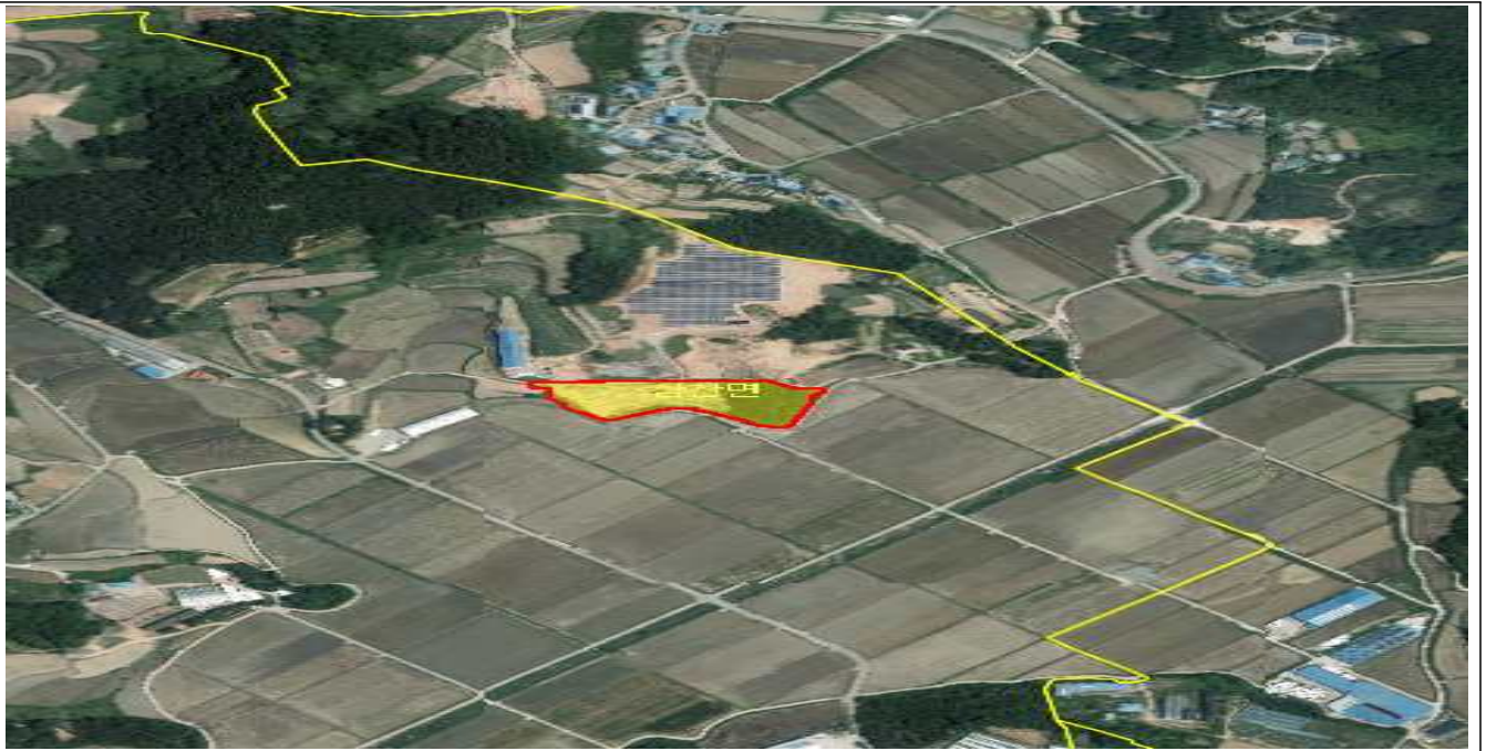
전남 해남군 삼산면 신흥리 산12