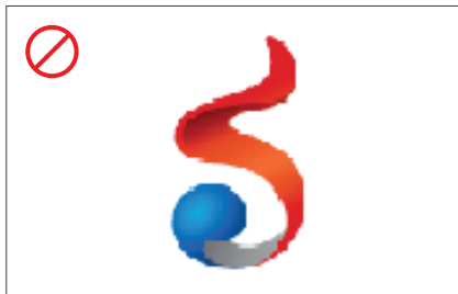
상태가 불량한 심벌마크를 사용한 경우