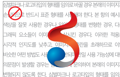
심벌마크에 최소공간규정을 적용하지 않은 경우