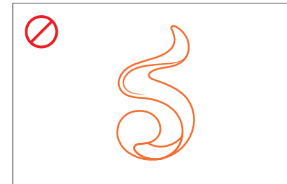
심벌마크를 라인형으로 표현한 경우