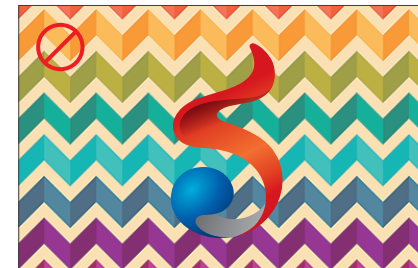
심벌마크를 복잡한 배경 위에 사용한 경우