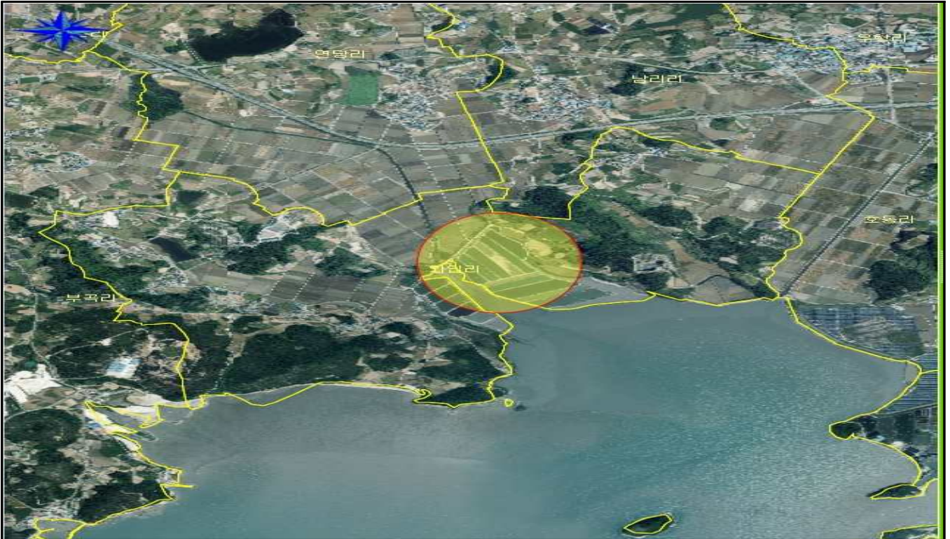
전남 해남군 황산면 외입리 325-6 외 10필지