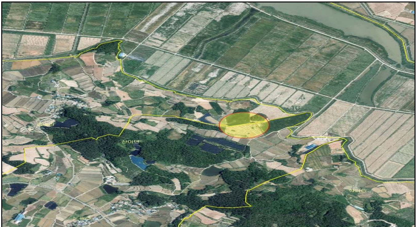
전남 해남군 산이면 금송리 산3-3, 산3-4