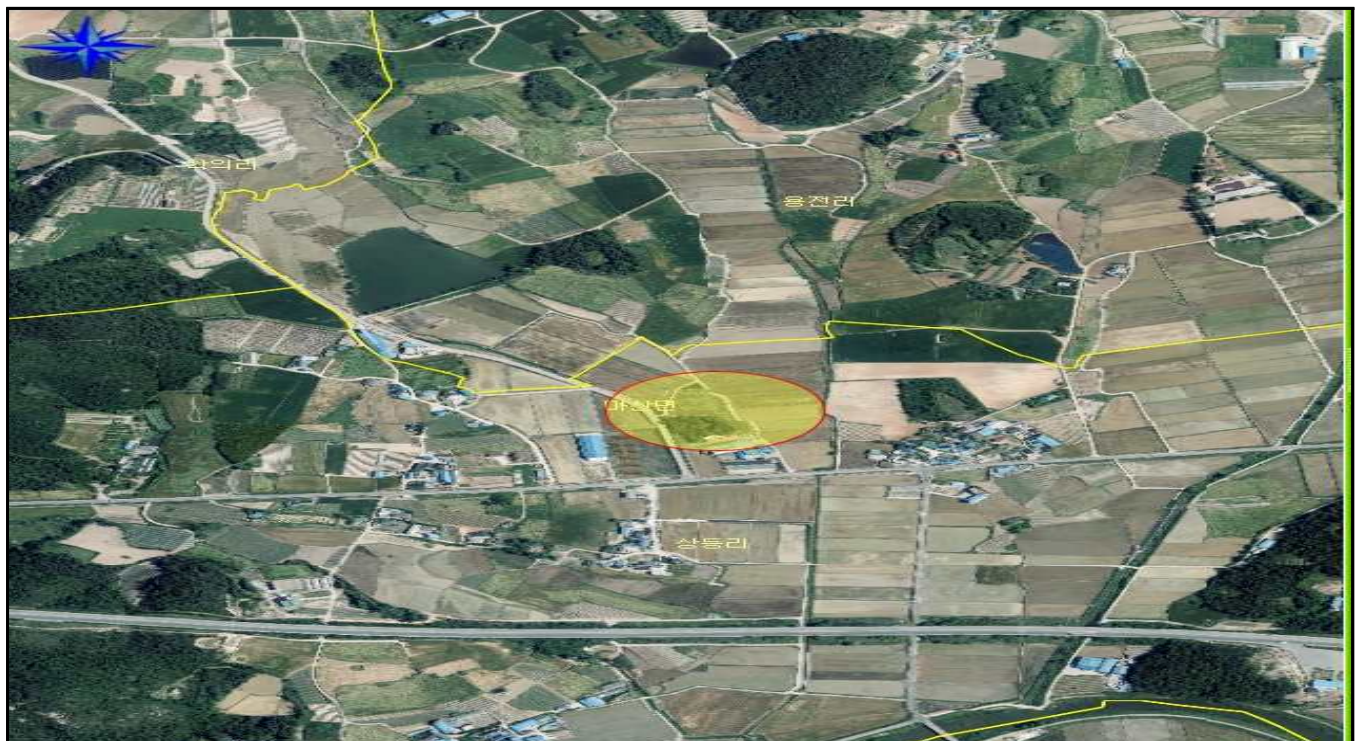
전남 해남군 마산면 상등리 872-15