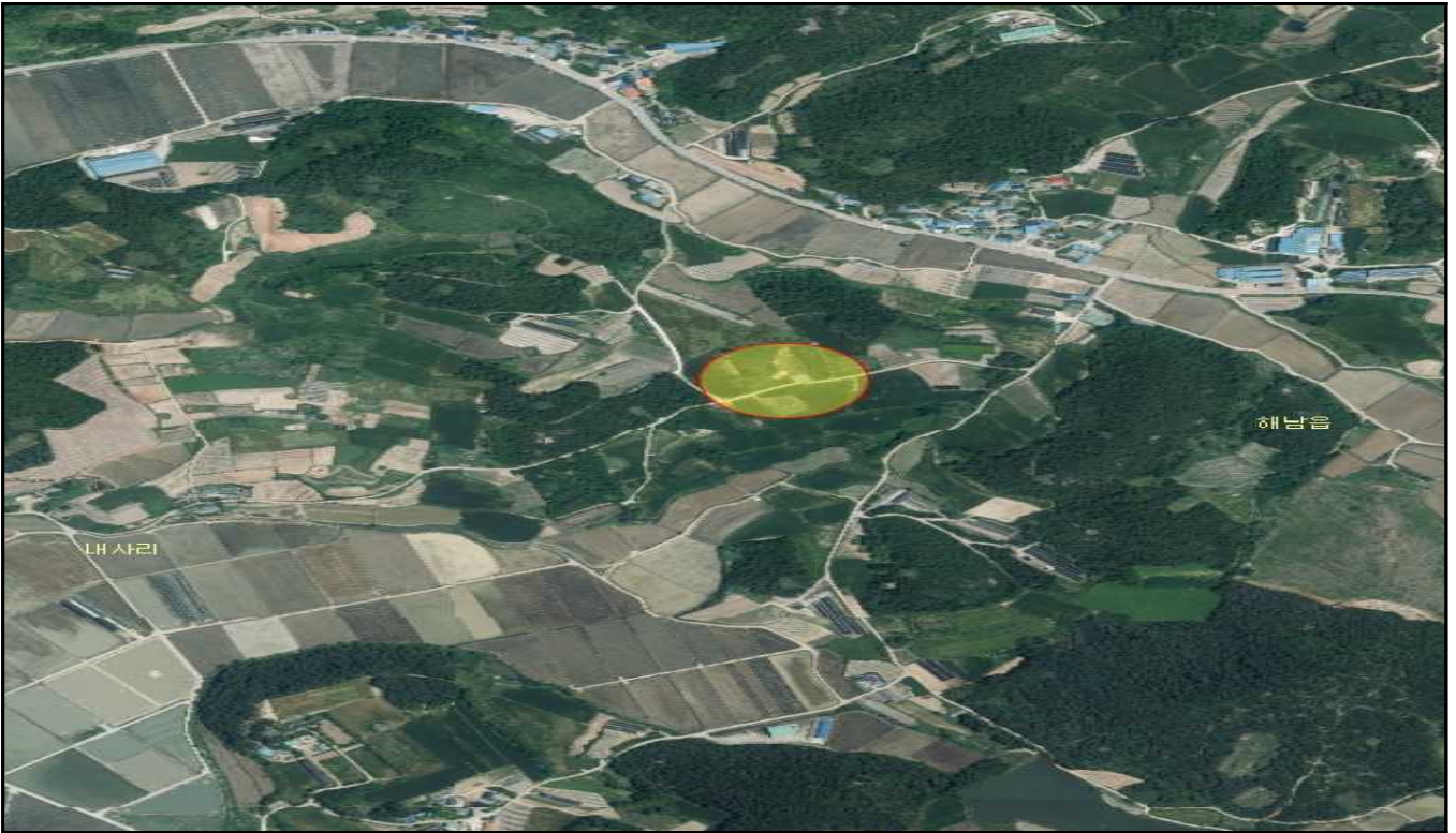
전남 해남군 해남읍 내사리 산144-2, 산144-10, 산144-15