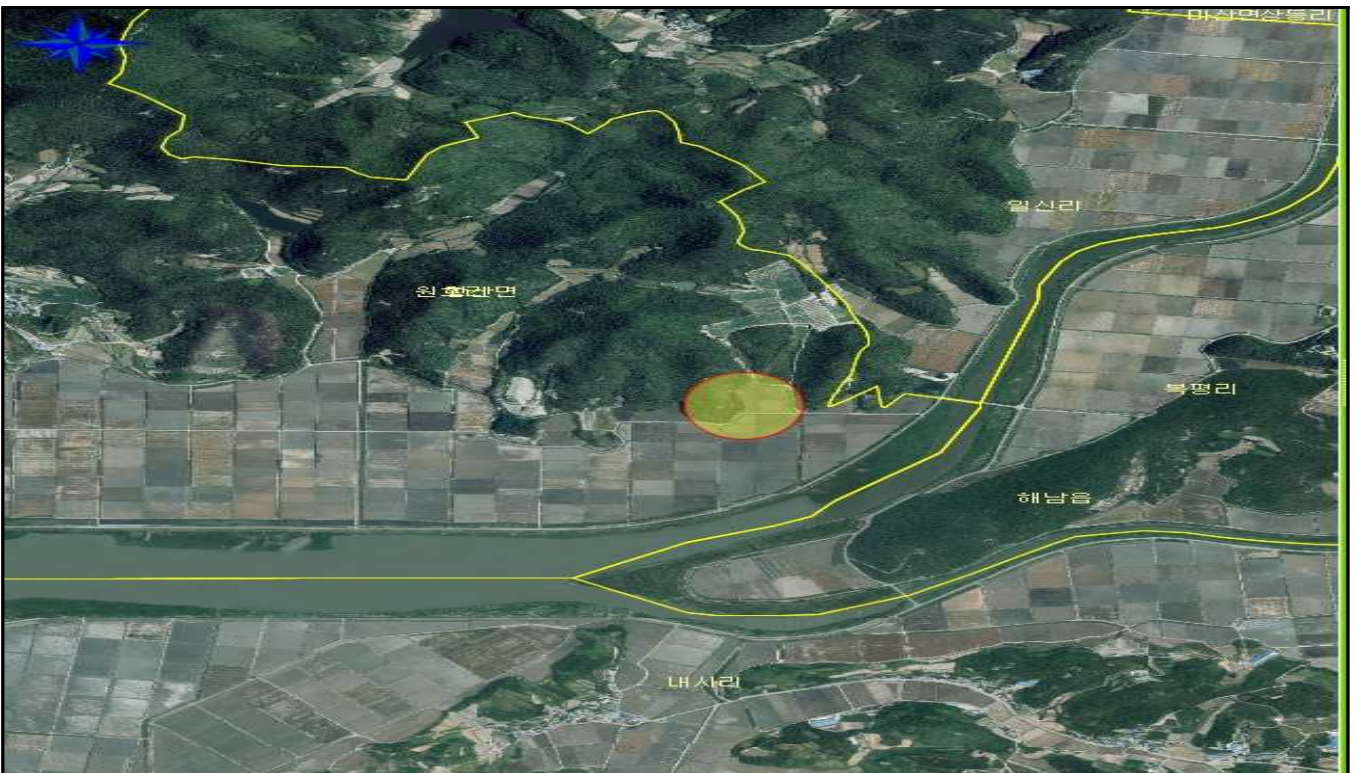
전남 해남군 황산면 원호리 산164-1