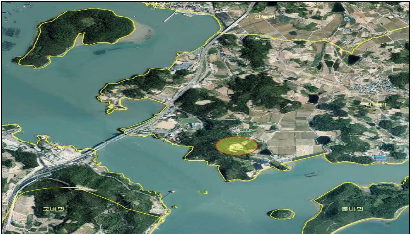
전남 해남군 문내면 학동리 산45