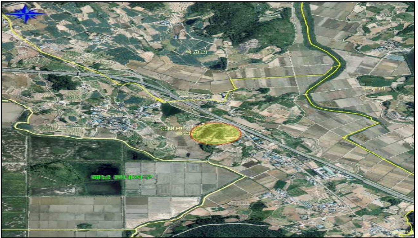
전남 해남군 문내면 용암리 산159 외 1필지