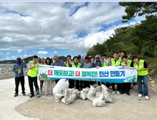
바닷가 주변 청소