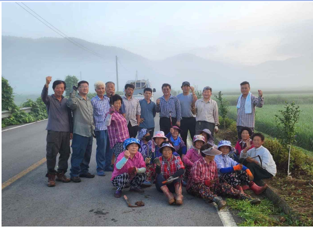
주민들이 가꿔가는 마을