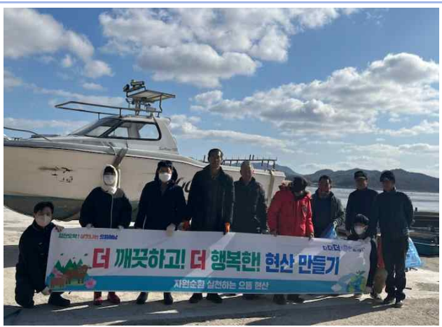
바닷가 주변 청소