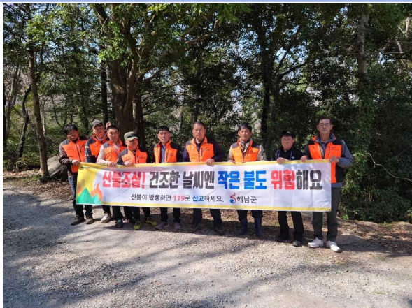
산불방지 예찰 활동