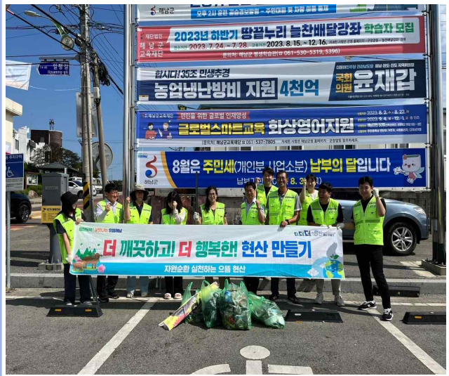
깨끗한 해남 만들기 캠페인