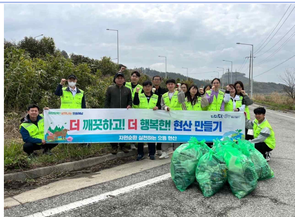
교차로 주변 쓰레기 줍기