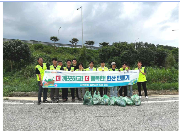
교차로 주변 쓰레기 줍기