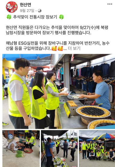
해남형ESG 캠페인 참여