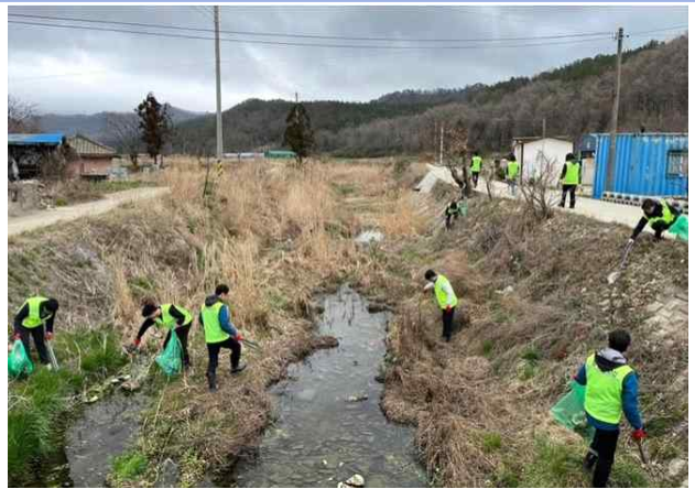
하천 주변 쓰레기 줍기