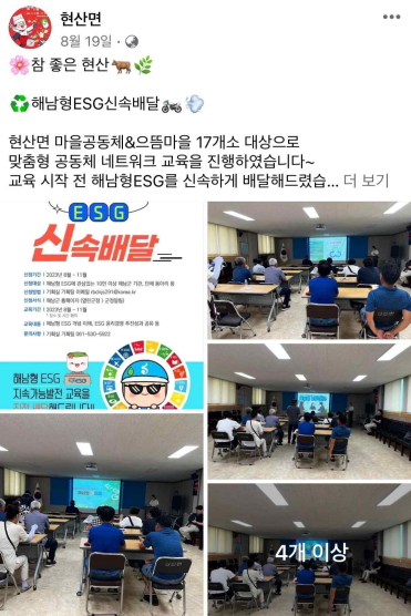
해남형ESG 신속배달 추진