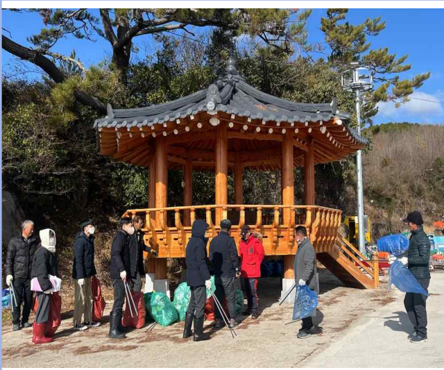
쓰레기 제로! 해남 515! 사업 참여