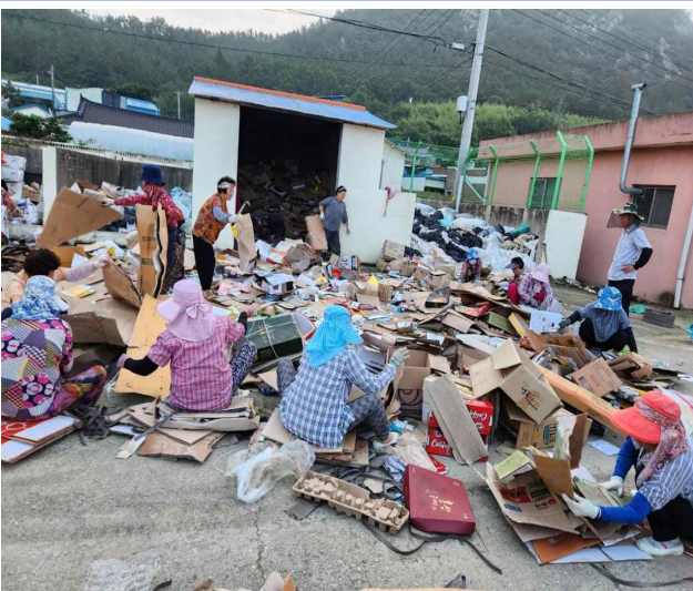
쓰레기 제로! 해남 515! 사업 참여