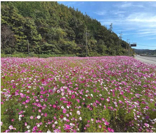
도로변 유휴지 활용 꽃밭 가꾸기