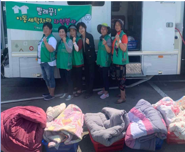
이웃과 함께 빨래봉사