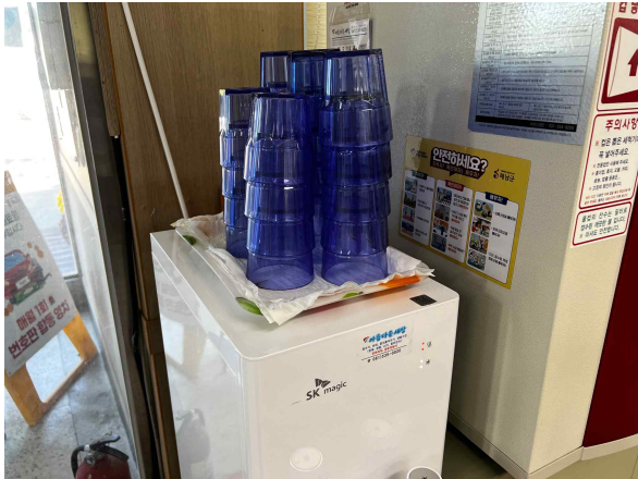
다회용 물컵 사용