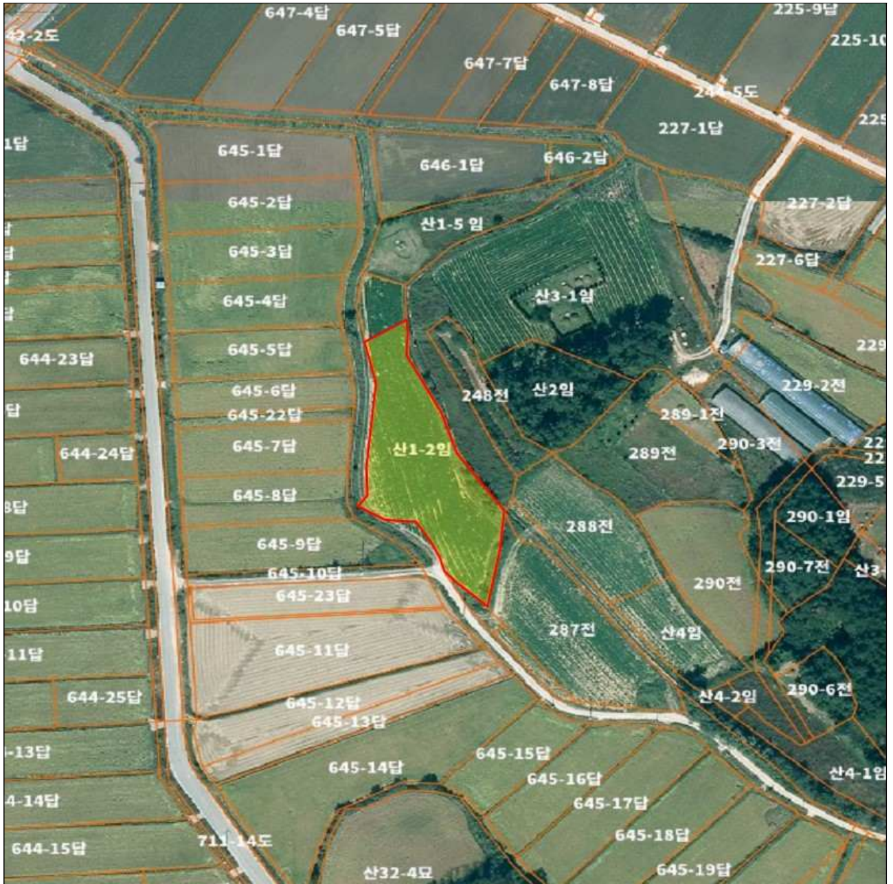
전라남도 해남군 해남읍 백야리 산1-2임