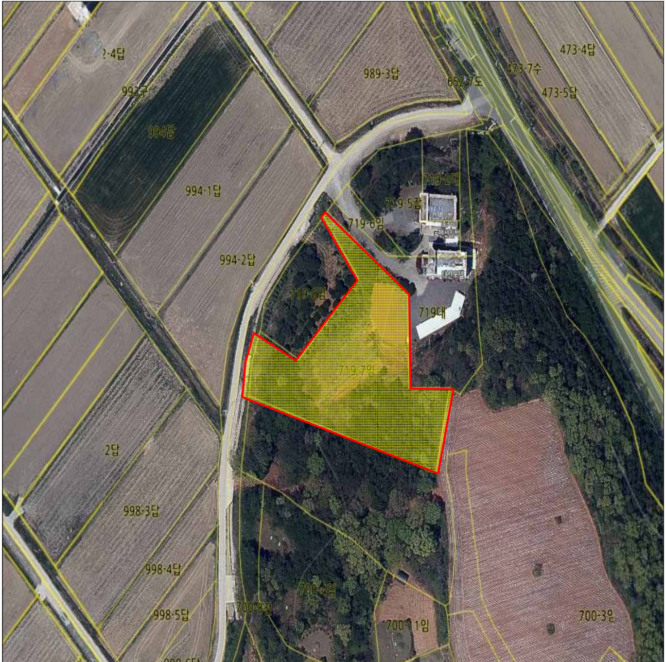
전라남도 해남군 해남읍 연동리 719-7임