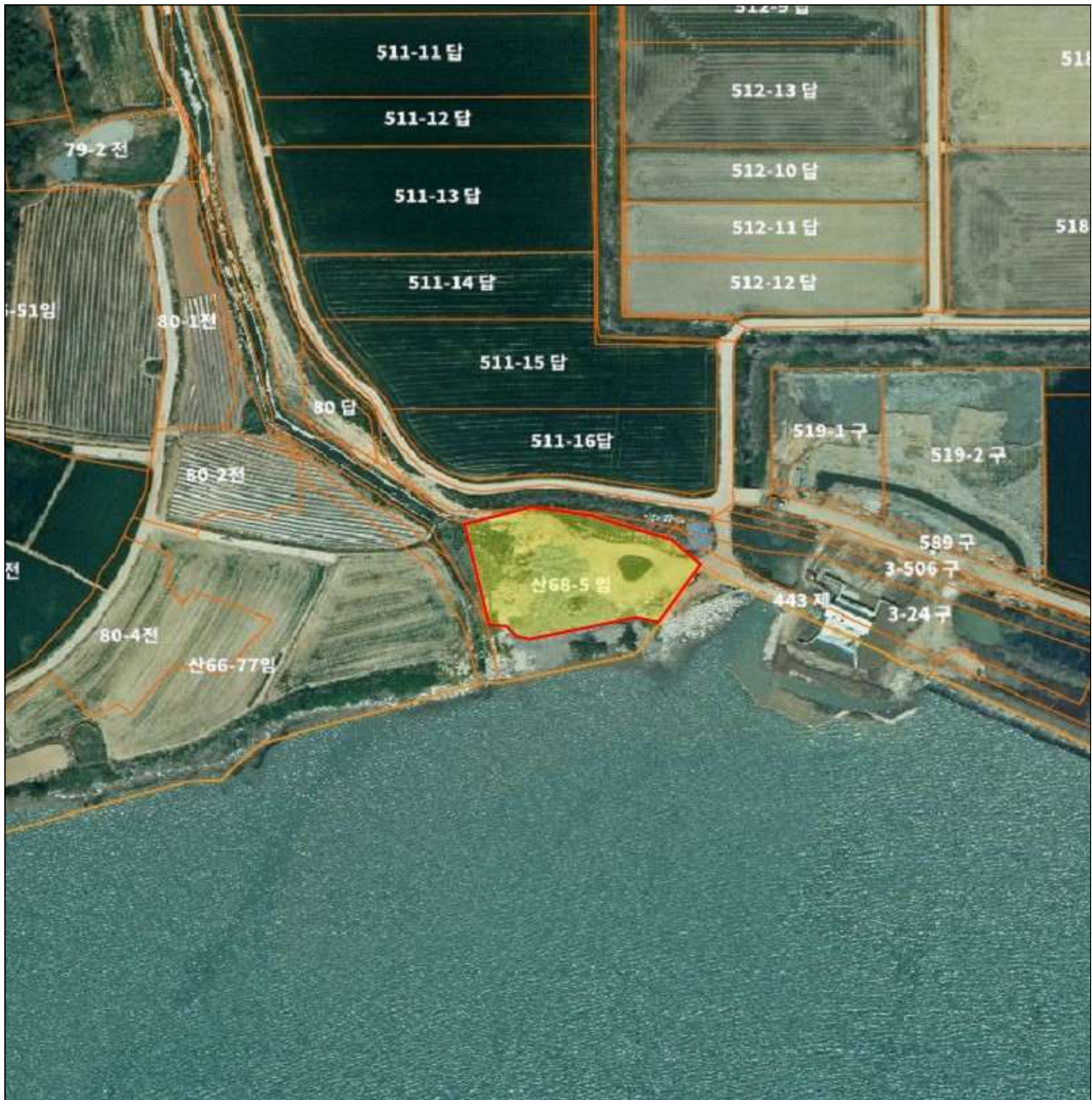
전라남도 해남군 황산면 옥동리 산68-5임