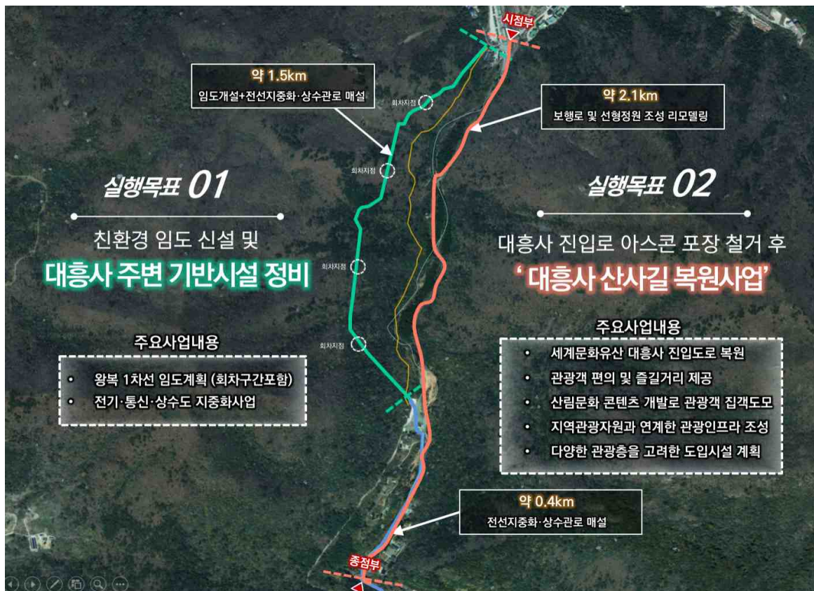
[그림1-2] 사업 목표