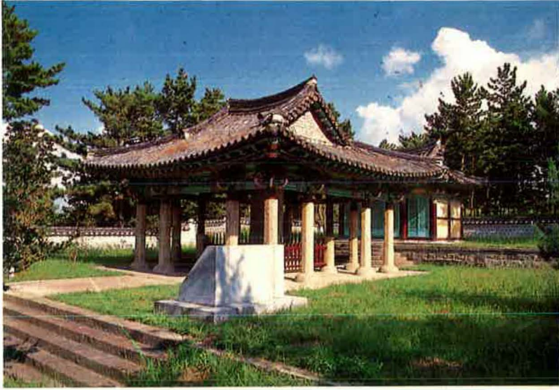
(충 무 사)

충무공 이순신장군의 명량대첩지인 울돌목과 전첩비, 사당이 있으며 1984년 개통된 진도대교가 위용을 자랑하고 있는 국민심신위락과 역사적 교육효과를 겸한 관광지임.