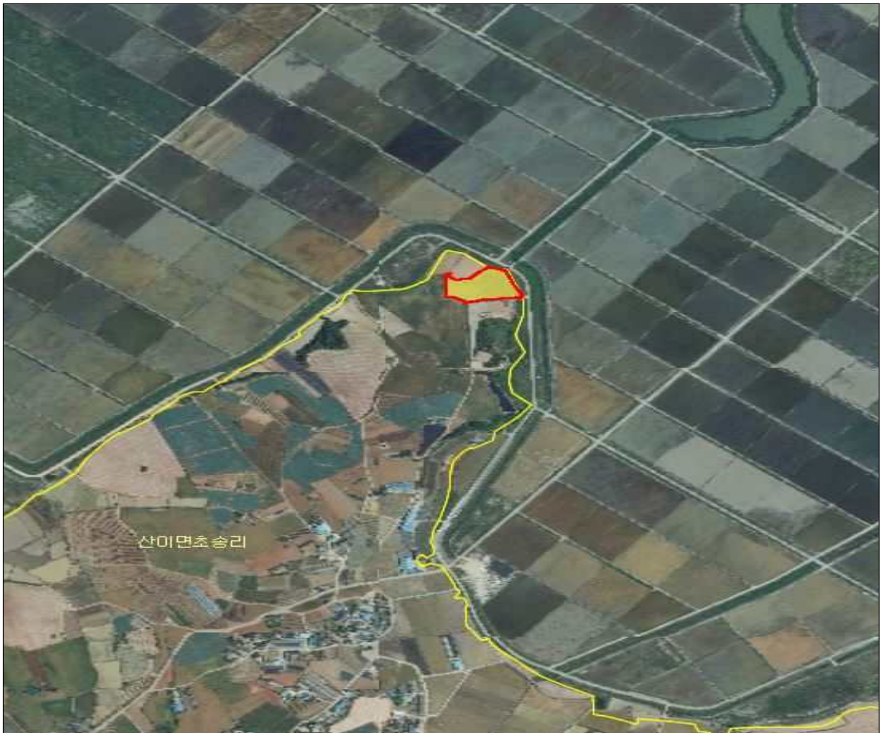
전남 해남군 산이면 초송리 산95-1