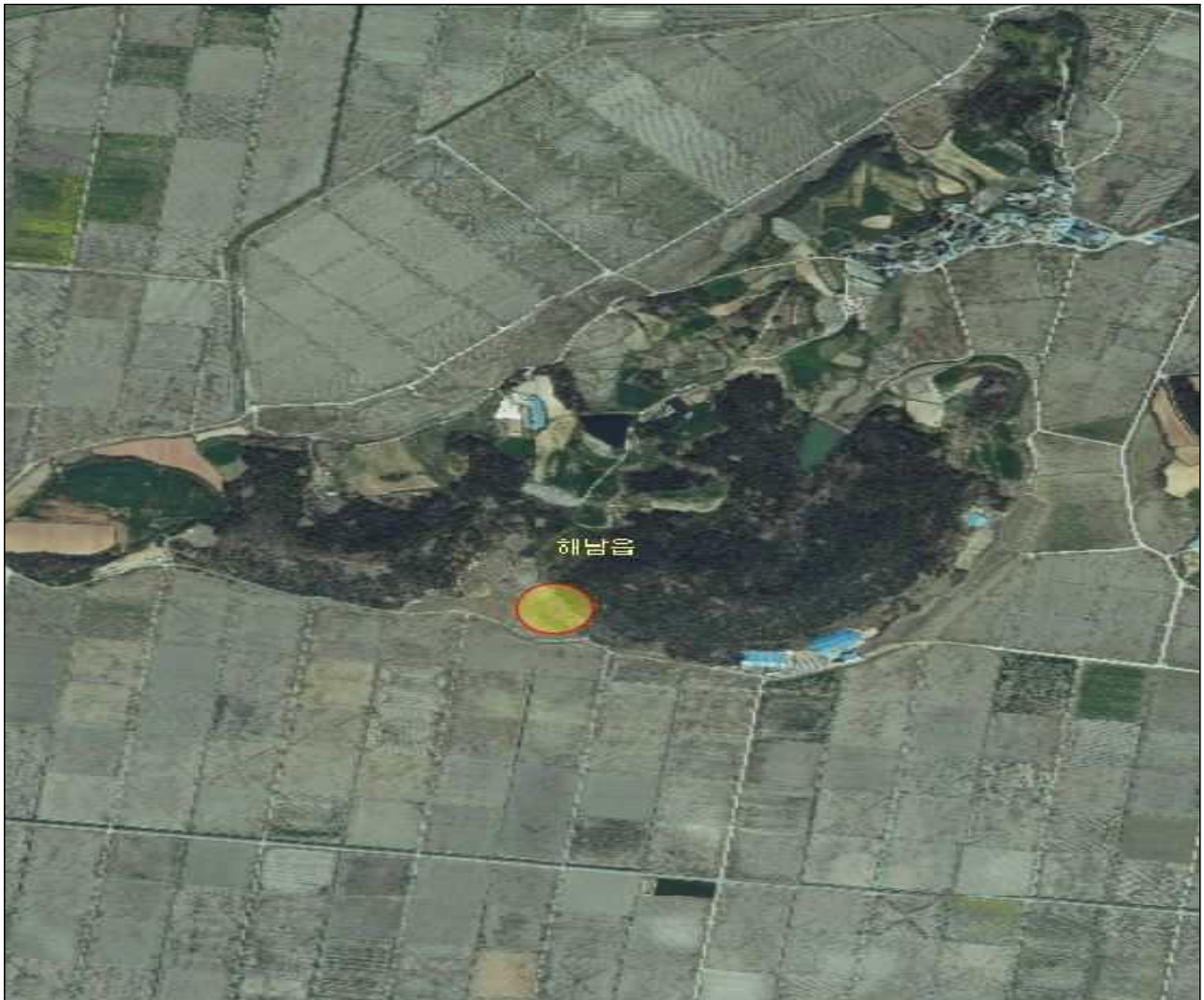
전남 해남군 해남읍 내사리 산175, 산175-1