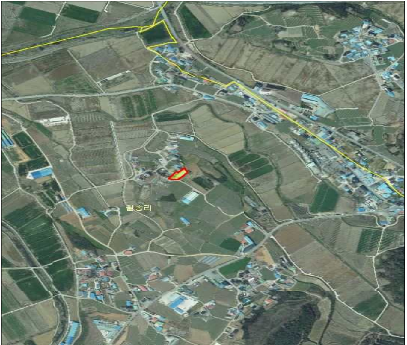
전남 해남군 현산면 월송리 353-1