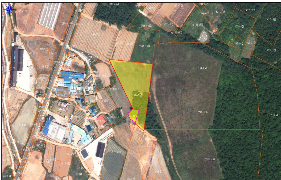
송지면 송호리 624-2임 외 1필지