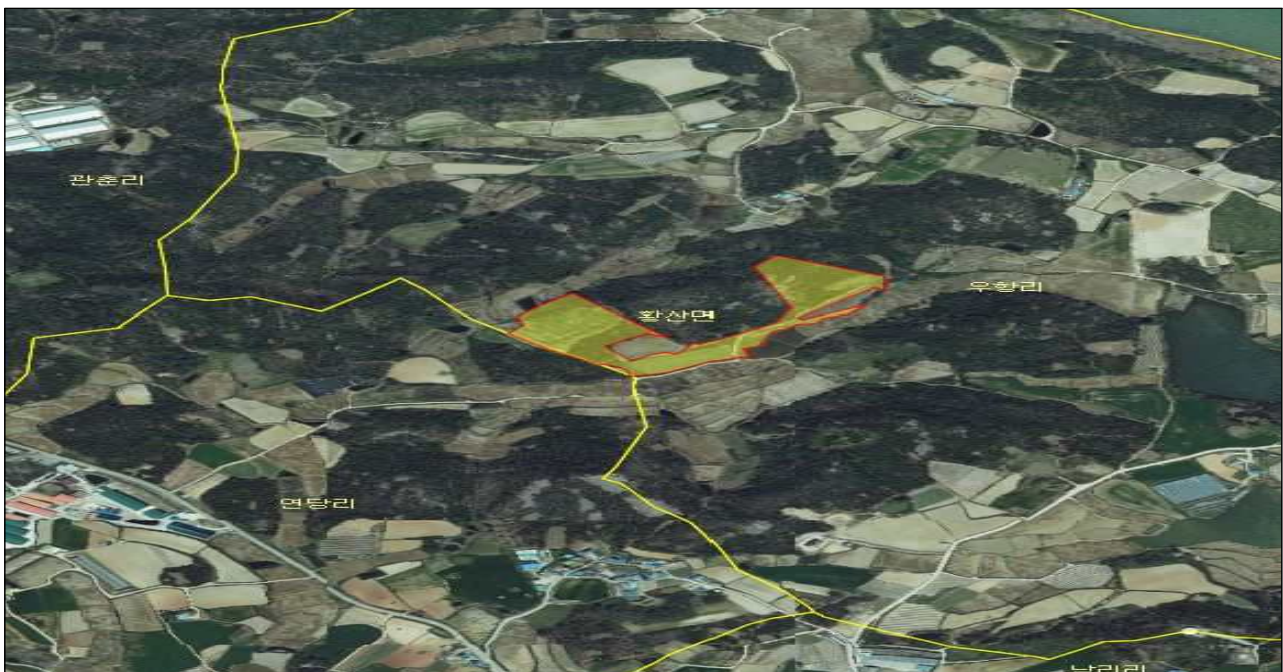
전남 해남군 황산면 우항리 산12-7, 산12-15, 산12-33