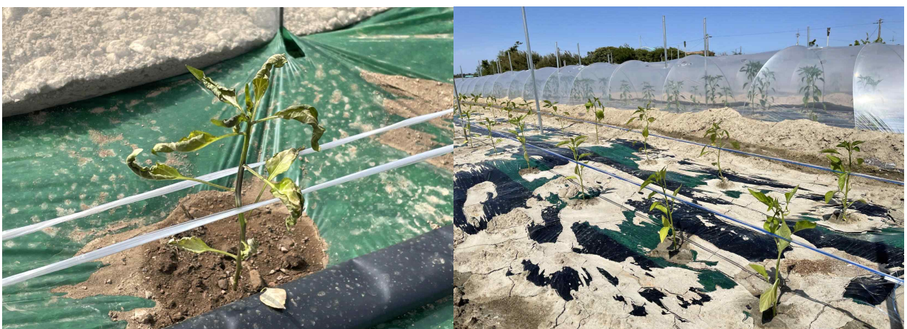
조기정식으로 인한 고추 서리피해

* 담당자 : 농업기술센터(원예작물팀) 임지우 농촌지도사(061-531-3874)