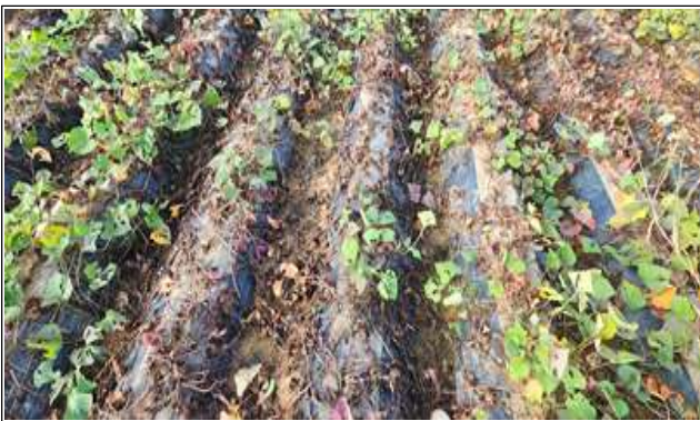
고구마 덩이줄기썩음병 발병 포장