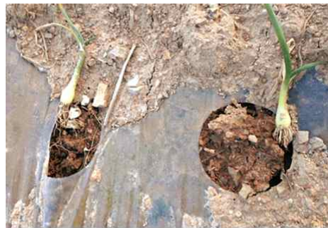
양파 서릿발 피해

* 담당자: 농업기술센터(원예작물팀) 임지우 농촌지도사(061-531-3874)