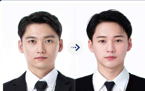
사진 원본 ○