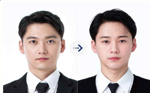
사진 원본 ○