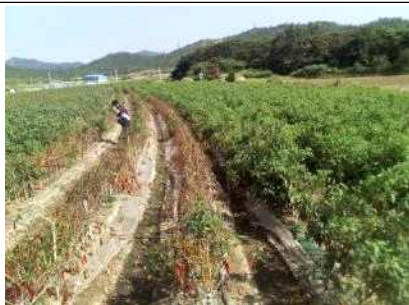
습해 및 풋마름병 피해 포장