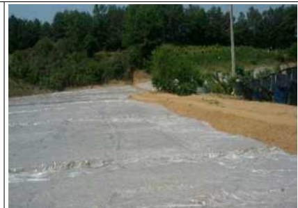
약제 살포 후 백색비닐멀칭