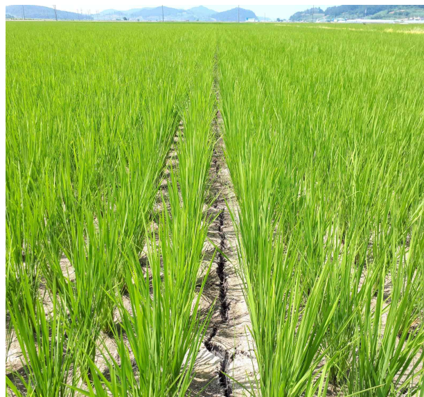
< 중간물떼기 >