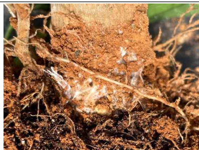
흰비단병 감염 초기(균사 형성)