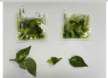
바이러스 감염 의심 키트 감정 의뢰

* 담당자: 농업기술센터(원예작물팀) 임지우 농촌지도사(061-531-3874)