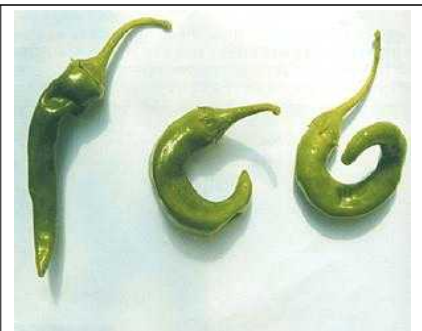
고온 피해 증상: 수정불량

* 담당자 : 농업기술센터(원예작물팀) 임지우 농촌지도사(061-531-3874)