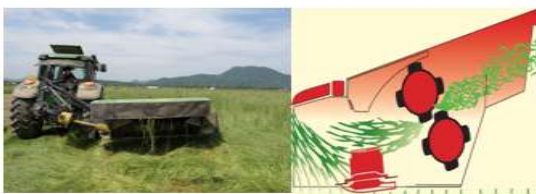
수 확 + 컨디셔닝(1일)