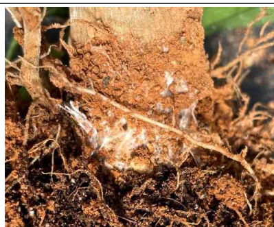
흰비단병 감염 초기(균사 형성)